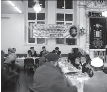
Отмечаем начало правления Рэбэ Шлита

10 Швата – 15 января в Кишиневской синагоге состоялся знаменательный фарбрэйнген, посвященный началу правления Рэбэ Шлита. Этот день торжественно отмечается хабадским движением во всем мире. Именно десятого Швата 5710 года (1950 г.) завершился великий переломный период в Движении Хабад. Душа Шестого Любавичского Рэбэ, Рабби Иосифа Ицхака Шнэйурсона отправилась в духовные миры. Ветераны Движения и молодежь с надеждой смотрели на Рабби Мэнахэма-Мэндла: для них было естественным считать его