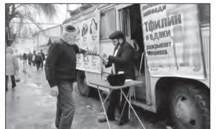
На улицах столицы