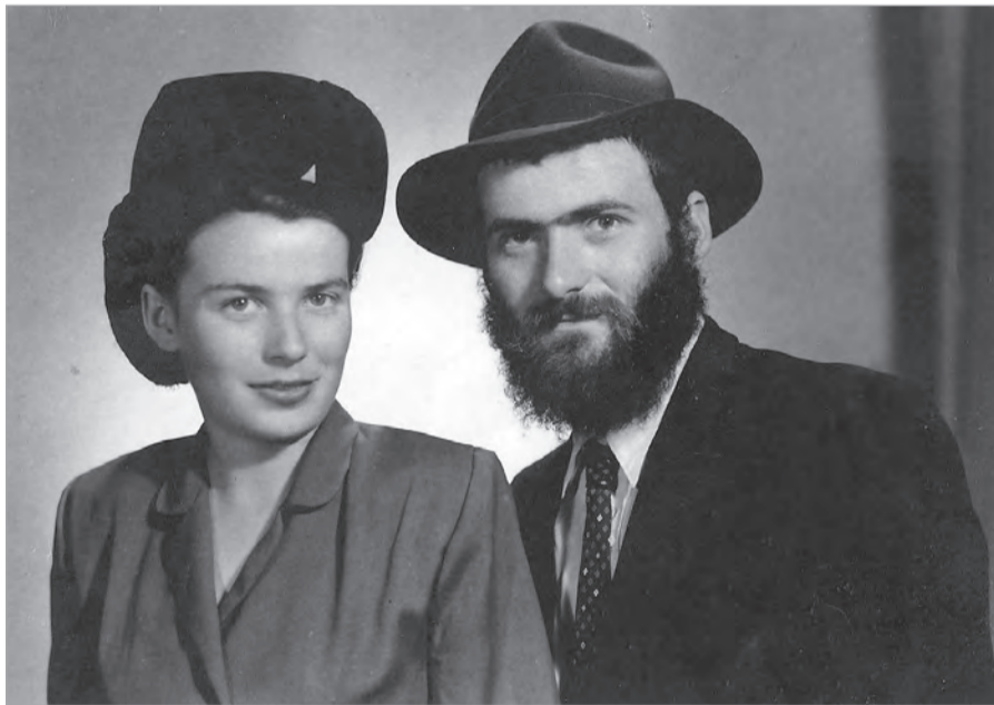
В первые годы супружества.