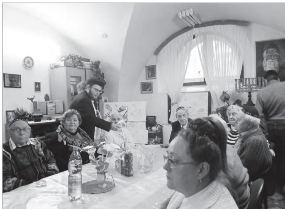
Ту Бишват в Кишинёвском Хэсде

Каждый вид деревьев отличается как по внешнему виду, так и своим предназначением, и веществом, из которого состоит. Самая заметная часть, «краса дерева», – его крона образована ветвями и их зеленым одеянием – листьями. У каждого вида деревьев своя крона: определенной формы и величины. Есть деревья с круглой кроной, напоминающей по форме шар, есть с пирамидальной, есть с овальной. И уж нечего упоминать о том, что у каждого вида деревьев своя форма листьев: об этом знают все. Каждый, увидев пучок листьев,