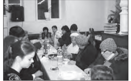
На женской половине

Свет Хабада, ярко вспыхнувший более двух веков назад на пятячке сла-