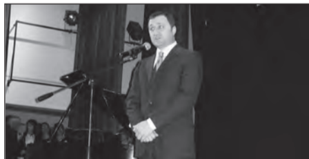
Речь премьера Влада Филата

Премьер-министр Молдовы Влад Филат поблагодарил за приглашение в КЕДЕМ. - Нахожусь здесь в первый раз, - сказал он. - Согласен: для того, чтобы