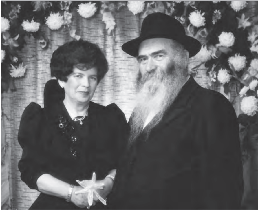
По приезде в Молдову

Совершенно не так у евреев. Брак – отнюдь не уступка природе, не снисхождение к человеческой слабости, но Б-жественная заповедь, почетный долг и величайшее благо. Напротив: полное отречение от супружества и рождения детей рассматривается еврейской традицией как нарушение строжайшего запрета.