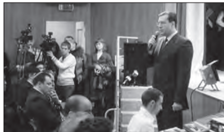
Выступает Мариан Лупу

По окончании митинга его участники собрались в актовом зале Кишиневского