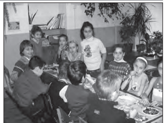
В конкурсе о Ту Бишват в лицее им. Рамбама победили девочки.

Праздник прошел в очень веселой атмосфере, сажать растения понравилось как самым маленьким, так и самым взрослым!