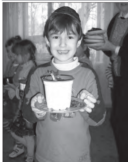
А я посадил цветок