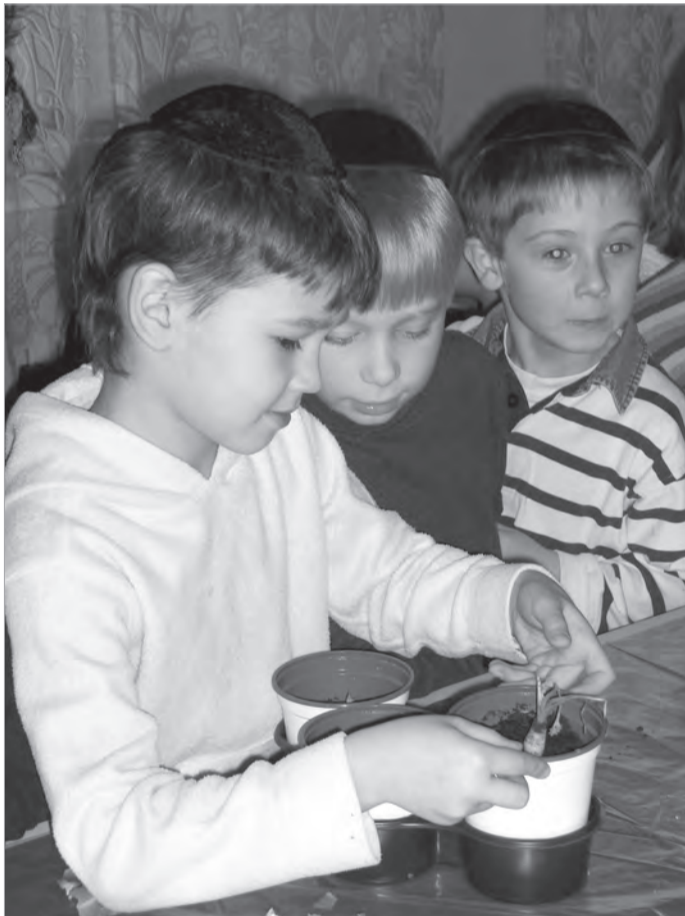
Новый год деревьев в Кишинёвском еврейском детском саду №65

По преданию, именно в Ту Бишват в Земле Израиля завязываются этроги – цитрусовые плоды, необходимые для исполнения заповеди о «четырех растениях» праздника Суккот. Поэтому существует хасидский обычай молиться в этот день о том, чтобы удостоиться чести приобрести на будущий год хороший, красивый этрог. Впервые об этом обычае упоминает галицийский каббалист рэбэ Цви-Элимелех Шапиро из Дивова (Пней Иссахар): «Мы получили от наших отцов традицию молиться в Ту Бишват, чтобы Б-г подготовил для нас кошерный и особенно прекрасный этрог, с которым мы могли бы исполнить заповедь – ибо этот день является временем, когда в деревьях поднимается живительный сок, а этрог, который