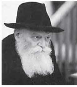
Обращение Любавичского Рэбэ ко всем еврейским женщинам и девушкам - матерям, невестам, школьницам.

«В наши дни все ищут света, который бы прогнал тьму, в том числе духовную. Света, который согреет усталое сердце и осветит душу. Среди еврейских заповедей есть одна, которая связана со светом в буквальном смысле, – зажигание свечей в честь субботы и праздников.