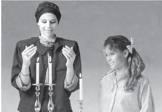
Законы зажигания свечей

Это не просто физическое действие. Это свет Торы, свет Б-га, одевшийся в лепесток золотого пламени. Быть может, мы не видим его, но у души тоже есть глаза – и они видят. Трудно измерить внутреннюю силу этого света. Свечи догорели, но свет остался и согревает еврейский дом всю неделю, от субботы до субботы. Более того, в наших святых книгах сказано об обещании В-вышнего: если евреи будут выполнять заповедь субботних свечей, то удостоятся увидеть свет Сиона - когда в мир, уже совсем скоро, придет Мошиах...»