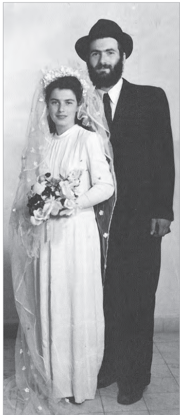
Это было недавно, это было давно...

В газете «Истоки жизни» мы неоднократно писали о благотворительной деятельности рэбэцин Лэи. Ее работу